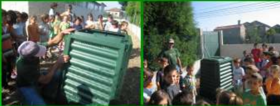
Distribuição de Compostores por todas as Escolas do 1º CEB e Escolas dos 2º, 3º CEB