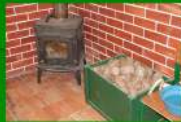
Estilha / Briquetes e Oleões