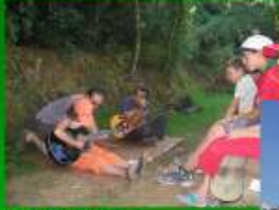
Construção de sons