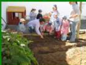
Hortas escolares e construção de jardins