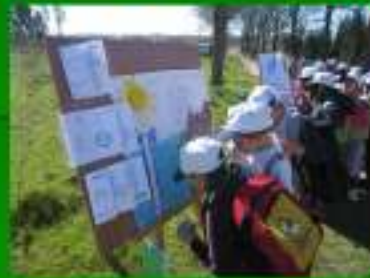
Dia Mundial da Floresta / Água