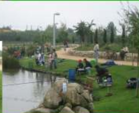
Iniciação à Pesca