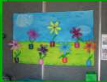
Stand AEC's - Feira de Artesanato e Gastronomia