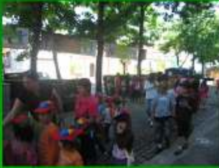
Feira de Artesanato e Gastronomia "Visita ao Espaço Ambiental"