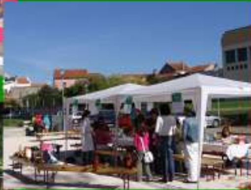
Criar com frutas secas