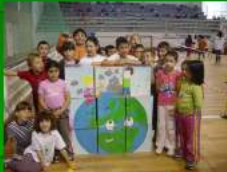
Actividades de Encerramento de Anos