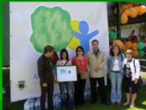
Logótipo / slogan do Ambiente