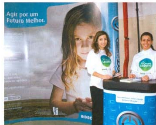
Materiais didácticos para o consumidor no stand das brigadas carbono

de jovens dotados de formação na área do ambiente com missão bem definida: promover cerca de 650 acções de informação e esclarecimento em todo o País.