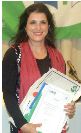
Escola Secundária Antero de Quental