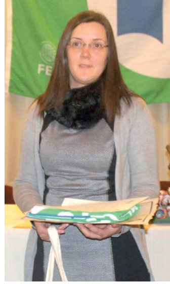
C.A.S.A. Bernardo Estrela