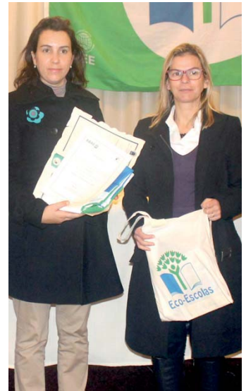
EBI S Vila Franca do Campo