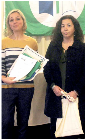
Escola Profissional de Capelas