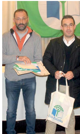
EBI Ponta Garça