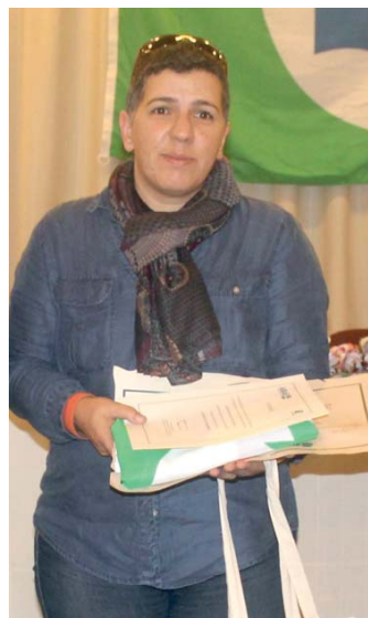
EB23 S Nordeste