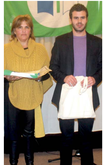
EBI S Povoação