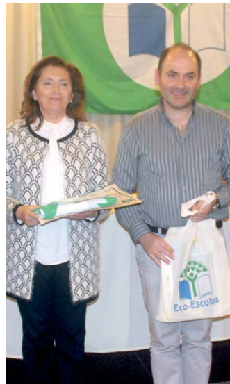
Escola Secundária Domingos Rebelo