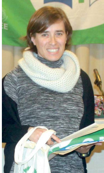
Colégio do Castanheiro

Todos estes programas, que apresentam galardões que premeiam boas práticas ambientais, com excepção do Jovens Repórteres para o Ambiente, que é um concurso, são coordenados e representados nos Açores pela Secretaria Regional da Agricultura e Ambiente, através da Direcção Regional do Ambiente, que tem assento nas respectivas comissões nacionais.