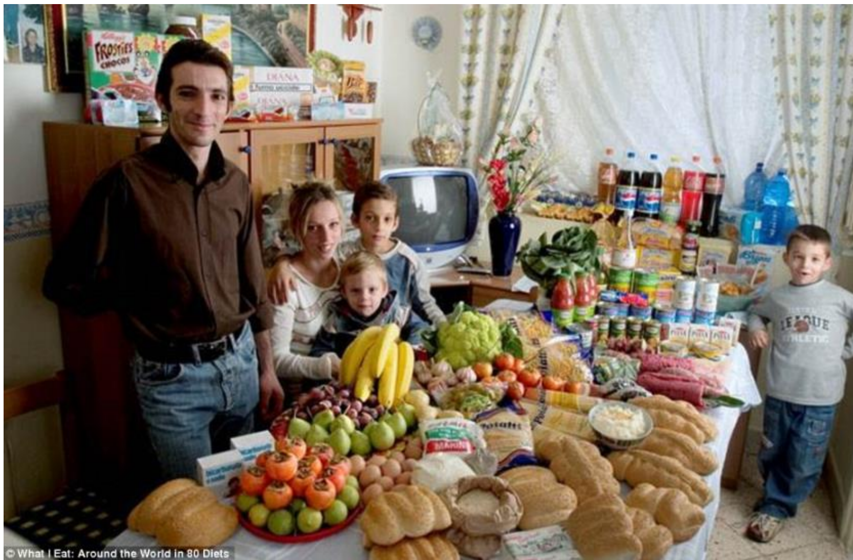
© What I Eat: Around the World in 80 Diets