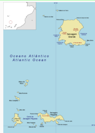
Mapa das Ilhas Selvagens