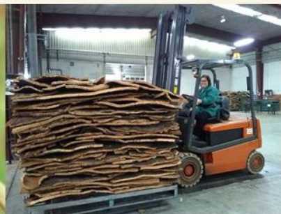
Imagem corporativa / produto