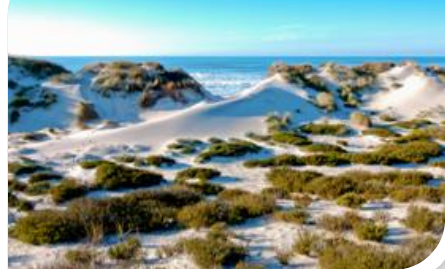
Praia do Osso da Baleia