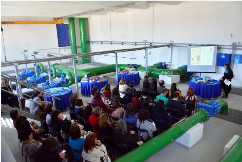
ETA da Mata do Urso