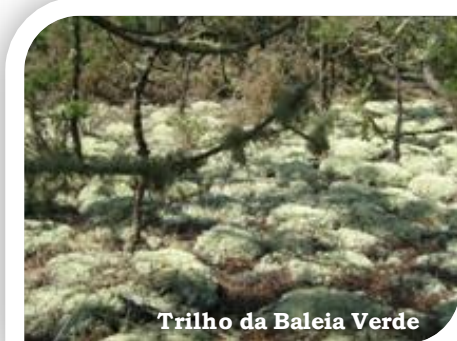
Trilho da Baleia Verde