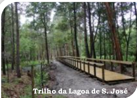
Trilho da Lagoa de S. José