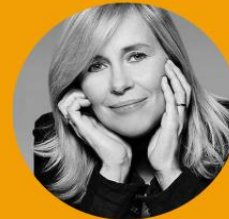
ISABEL STILWELL Jornalista