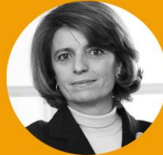
ISABEL ALÇADA Assessora para a Educação da Presidência da República