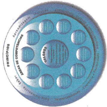
Figura 2 | Legenda contextual do Perfil das Ações do Eco-Escolas