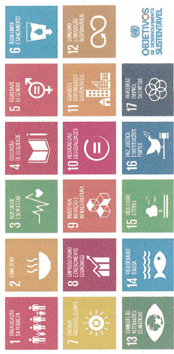
Figura 1. Exemplos concretos de ações de Eco-Escolas e suas áreas de atuação associadas.