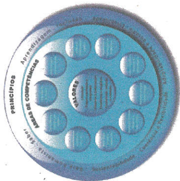
Figura 1. Esquema conceptual do perfil do Aluno do Eco-Escolas (adaptado de Gonçalves)