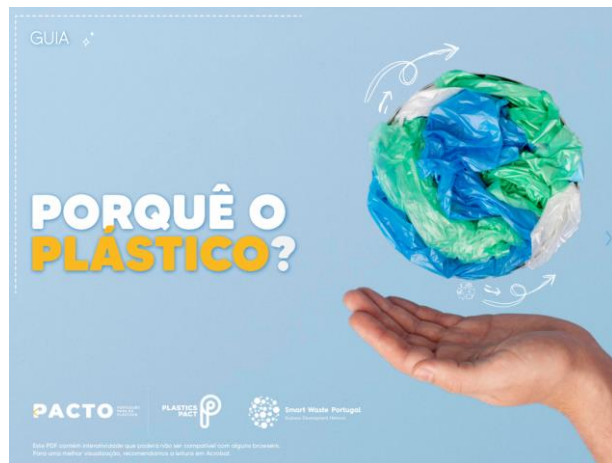
Guia “Porquê o Plástico?”