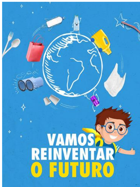
Programa Educativo “Vamos Reinventar o Futuro”