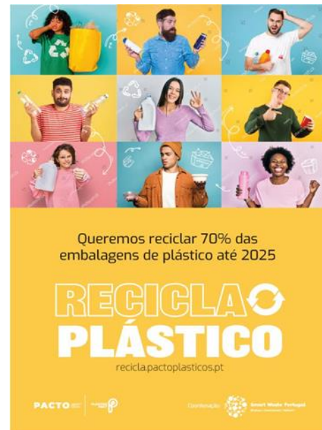
Campanha de Comunicação “Recicla o Plástico”