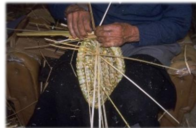
Uso de bunho ( Schoenoplectus lacustris ) para cestaria e esteiras.