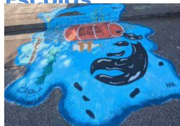
2º Prémio – Escola Básica Engº Fernando Pinto de Oliveira