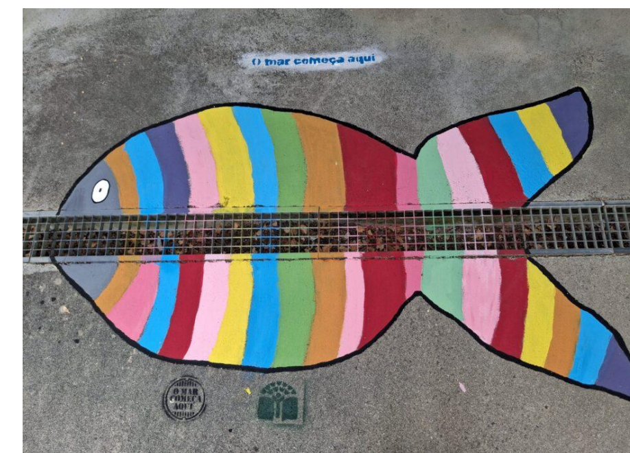
Soure, Município Premiado 24/25