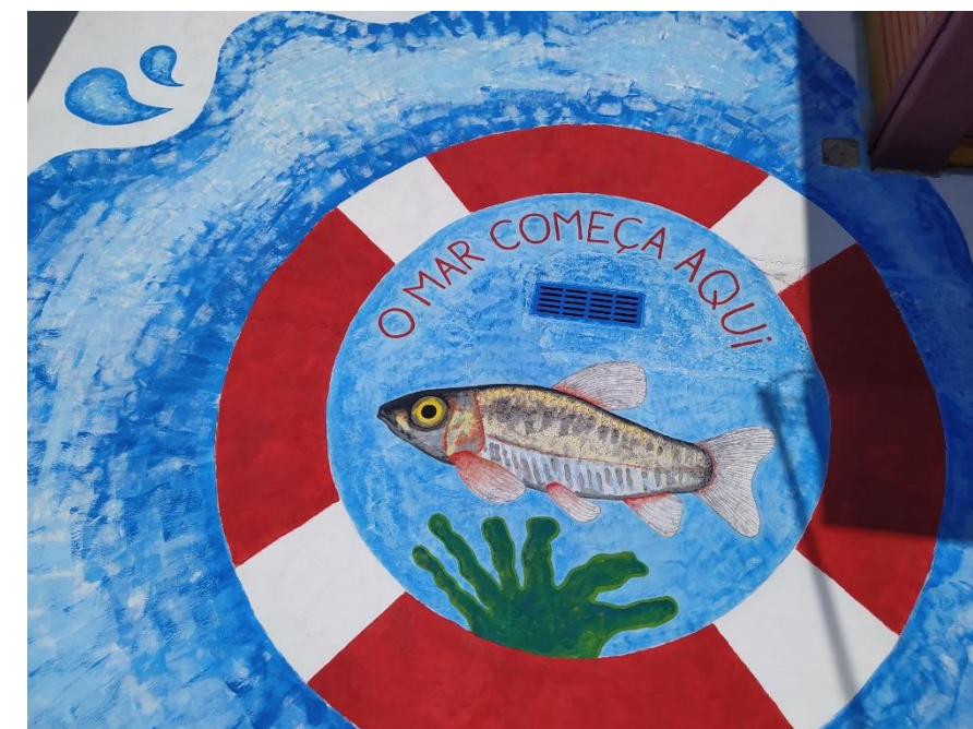
Escola EB 2,3 do Maxial (Vencedor Tejo Atlântico 24/25)