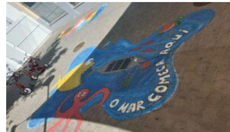
Jardim de Infância de Forte Novo, Loulé (Vencedor Algarve 24/25)

Para concorrer a este prémio a pintura deve apresentar o desenho de uma torre eólica e o logotipo OW