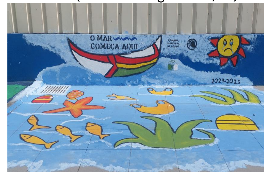
Centro de Bem Estar Infantil de Monte Real (Vencedor Centro Litoral 24/25)