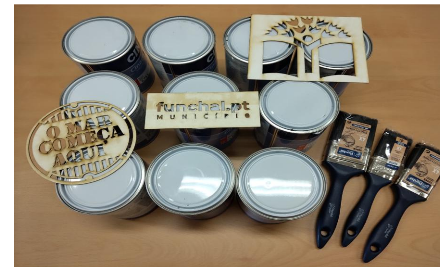
Funchal, Município Premiado 24/25