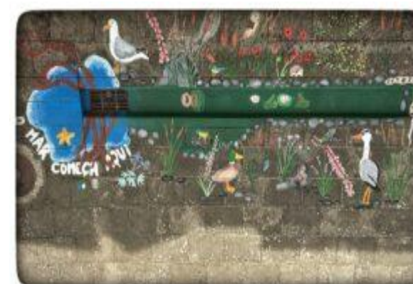
3º Prémio – EB nº1 da Lousã