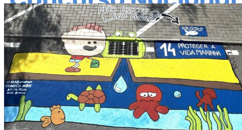
1º Prémio – Escola EB do Ramalhal