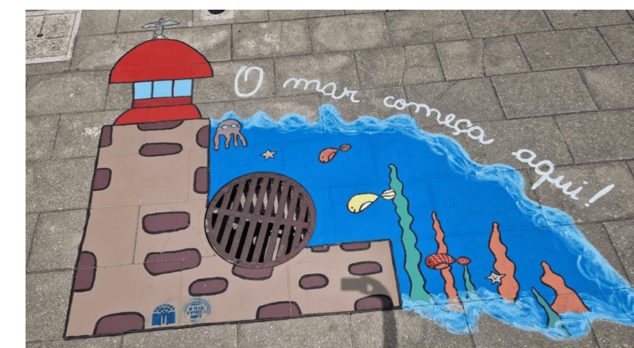
Nazaré, Município Premiado 24/25