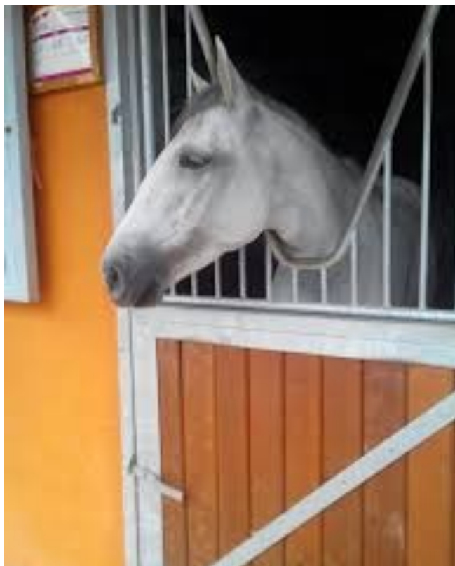
Etapa 1—Parque Equestre

Volta a cavalo, atividade pedagógica com o cavalo tendo por objetivo dar a conhecer a rotina do centro equestre e os hábitos alimentares e de higiene destes animais. É possível visitar a sala dos arreios, os padoques e as diferentes zonas de trabalho dos alunos, como por exemplo o picadeiro coberto. Todas as atividades têm o apoio dos alunos dos cursos técnicos de Gestão Equina e Turismo Ambiental e Rural.