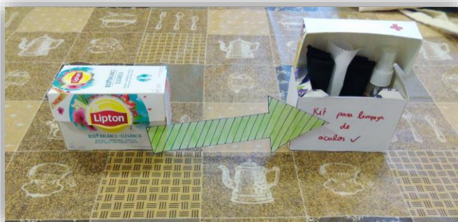
Figura 2 - Reutilização de uma caixa de chá vazia para fazer um kit de limpeza de óculos