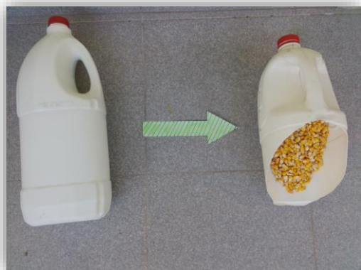
Figura 1 - Transformação de um garrafão num recipiente para recolher milho