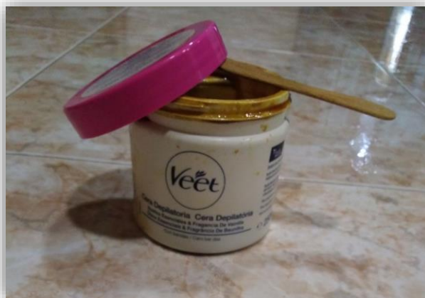
Figura 6 - Utilização de um pau de gelado para fazer a depilação