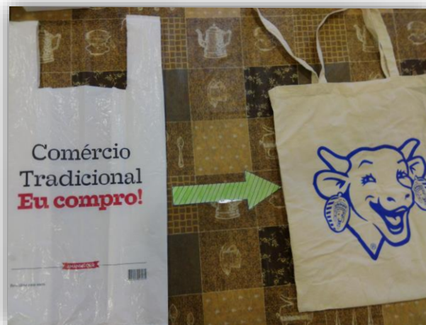
Figura 4 - Optar por um saco de pano que não tem fim em vez de um de plástico