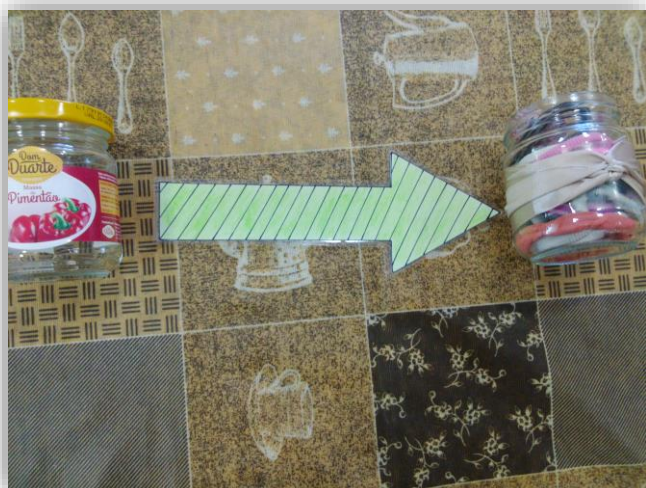
Figura 5 - Reutilização de um frasco de massa de pimentão, usando-o para armazenar elásticos para o cabelo