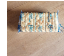
Pacote de bolachas