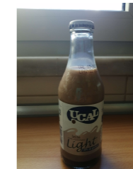
Garrafa de leite