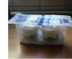
Embalagem de queijo fresco