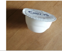
Embalagem de plástico de iogurte