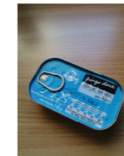
Lata de atum