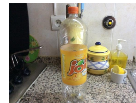
Figure 2-Resíduo plástico