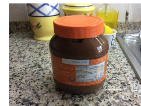
Figure 4 - Resíduo vidro