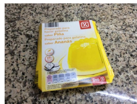
Figure 3 - Resíduo papel/cartão