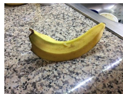
Figure 1 - Resíduo orgânico