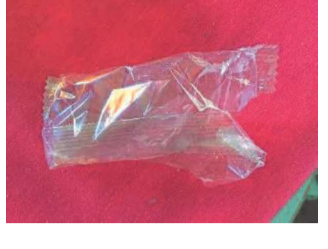
Pacote de comida