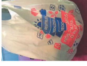
Saco de plástico