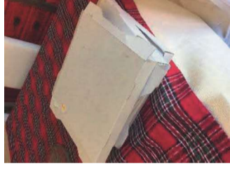
Caixas de cartão