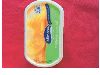
Embalagens de comida