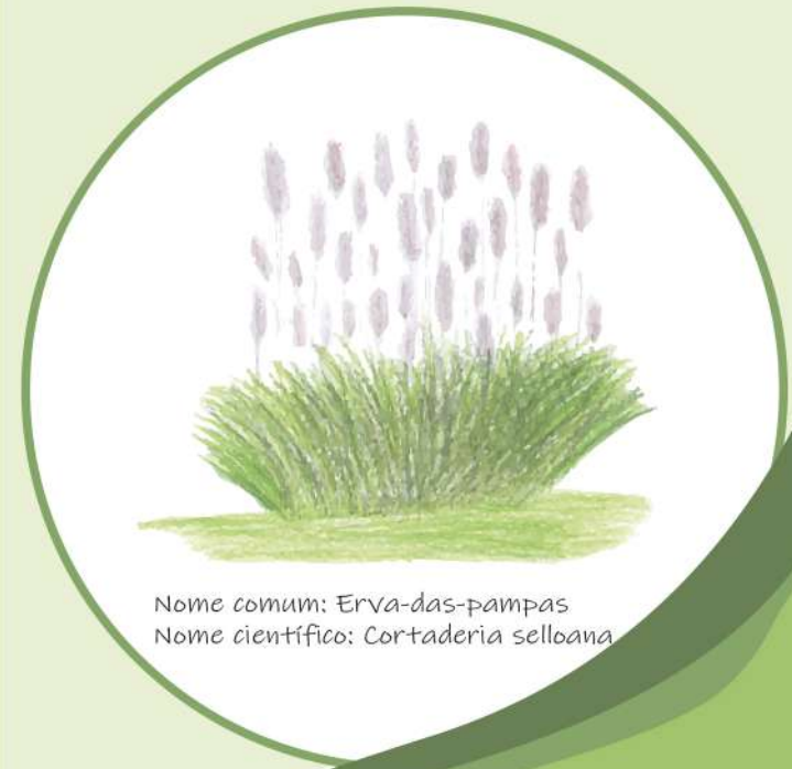
Nome comum: Erva-das-pampas Nome científico: Cortaderia selloana