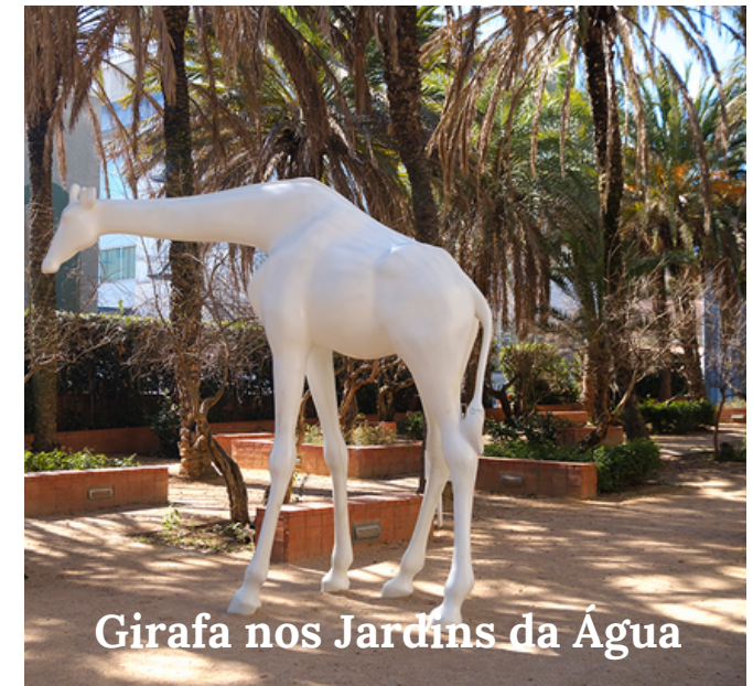
Girafa nos Jardins da Água

ECO-TRILHO A ARTE ANIMAL - No Parque das Nações