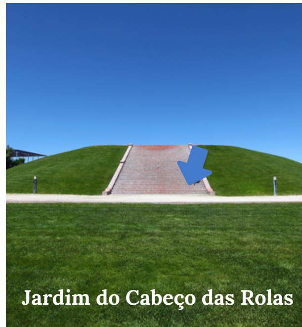
Jardim do Cabeço das Rolas

Curiosamente, em tempo de pandemia, surgiram algumas esculturas de animais com o reaproveitamento de lixo. Tendo em conta a riqueza de arte e esculturas, decidimos visitar a arte animal lá exposta, de forma a contemplar o respeito pela natureza e biodiversidade.