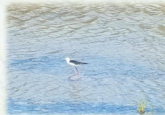
Foto da espécie

Faz posturas em abril e junho, de 4 ovos. A incubação, realizada por ambos os membros do par, dura 23 a 24 dias. O ninho é uma cavidade revestida no solo. Defendem o seu ninho das ameaças voando em círculos. Apresentam dimorfismo sexual. A fêmea não tem negro na coroa da cabeça e na parte posterior do pescoço. Alimenta-se maioritariamente de invertebrados - larvas de insetos, camarão-de-salina ( Artemia salina ), entre outros.