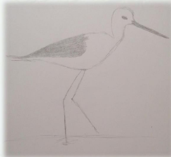
Ilustração da espécie