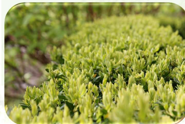
Foto da espécie