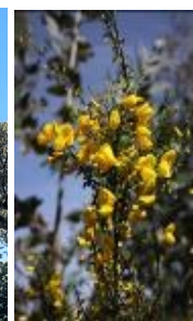
6 Calçada, sobreiro e giesta