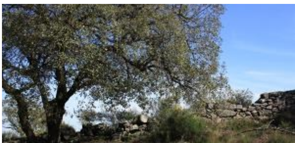
9 Muro castrejo

Mantendo-nos atentos ao nosso redor, descobrimos curiosos testemunhos do passado. Nesta fase do percurso, passaremos pelos restos de uma fortificação castreja que testemunha esta ocupação tão antiga. O topónimo Serra do Muro advém da existência de uma muralha com cerca de 4 metros de largura e 3.927 metros de perímetro, num circuito contínuo mas irregular.