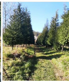
3 Caminho rural

Subindo pela Gralheira , o passeio faz-se por caminhos florestais, onde será possível encontrar marcas do passado histórico (Cruz de Pontas Redondas e Calçada Antiga) e recantos paisagísticos de grande beleza.