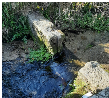
2 Presa de água

Os caminhantes, durante o percurso que interliga a vila e a serra, poderão reconhecer as relações que a população local continua a estabelecer com o espaço que ocupa, nomeadamente através do cultivo da terra.