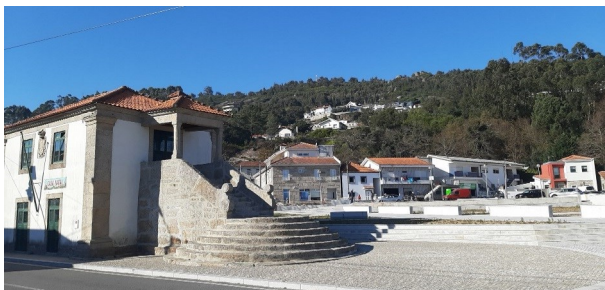
10 Largo Pereira Inácio e edifício da antiga Câmara

Depois da descida e quando o percurso se aproxima do final, podemos observar o edifício da antiga câmara, pois em tempos idos, Baltar formou concelho próprio que teria, no entanto, uma curta duração, de 1834 a 1837.