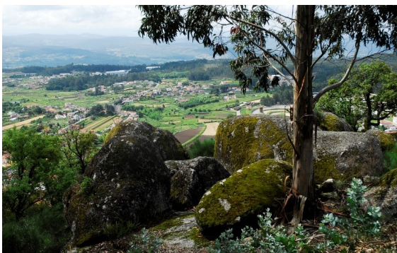
7 Vista panorâmica

Ao longo da subida, temos uma das mais bonitas vistas do vale e da vila de Baltar.