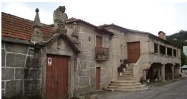
1 Casa do Areal

O percurso inicia e acaba na Escola Secundária Daniel Faria. Logo no início, encontramos a Casa do Areal , também conhecida por Casa de Bragança, o que se deve ao facto de Baltar ter pertencido, até ao século XIX, à Casa Real dos Bragança. O portal brasonado tem a data de 1769, provavelmente a data em que lhe foi atribuído o Brasão de armas reais, aquando do reinado de D. José I, que, segundo consta, aqui ficou hospedado.