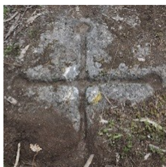
4 Cruz de Pontas Redondas

Subindo pela Gralheira , o passeio faz-se por caminhos florestais, onde será possível encontrar marcas do passado histórico (Cruz de Pontas Redondas e Calçada Antiga) e recantos paisagísticos de grande beleza.