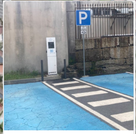
2 - Posto Elétrico