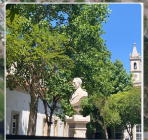
4 - Termas de Vizela