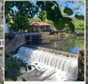
5 - Parque das Termas