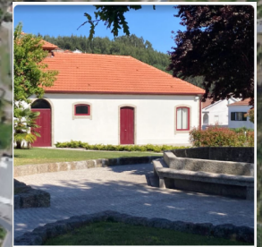
6 - Casa da cultura