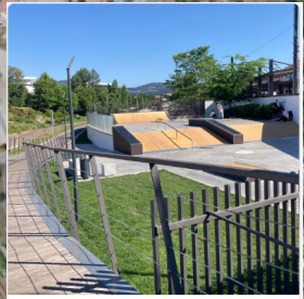
1 - Skate Park