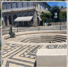
3 - Bica Quente