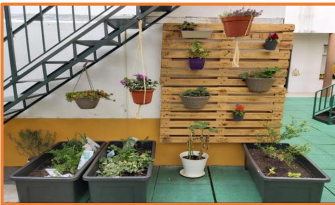
LOCAL DE INSTALAÇÃO