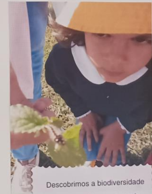
Descobrimos a biodiversidade no exterior da nossa escola.