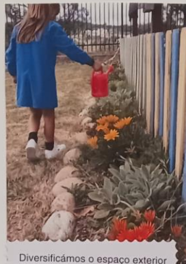
Diversificámos o espaço exterior com diferentes plantas.