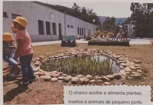
O charco acolhe e alimenta plantas, insetos e animais de pequeno porte.