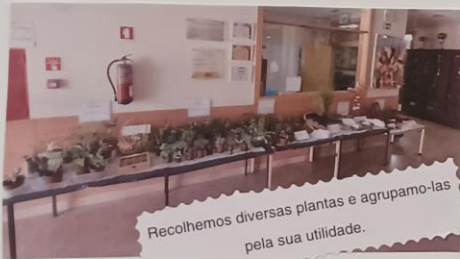
Recolhemos diversas plantas e agrupamo-las pela sua utilidade.