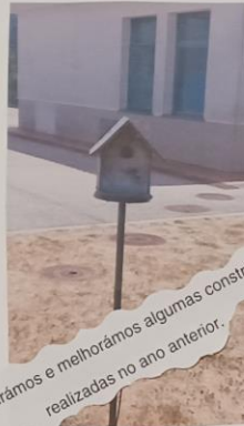
Restaurámos e melhorámos algumas construções realizadas no ano anterior.