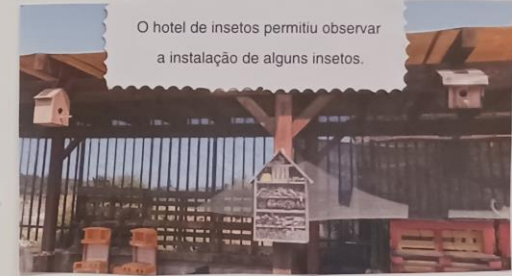
O hotel de insetos permitiu observar a instalação de alguns insetos.