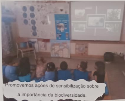
Promovemos ações de sensibilização sobre a importância da biodiversidade.

JII/ EB1 de Arganil Ano letivo 2022/2023