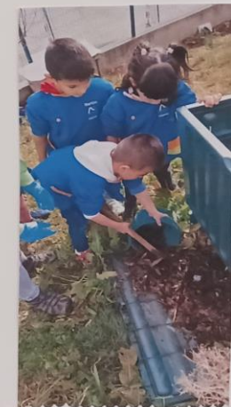
Vimos a importância das minhocas na decomposição do material vegetal.