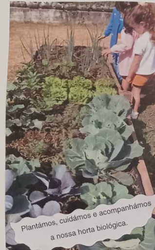
Plantámos, cuidámos e acompanhámos a nossa horta biológica.