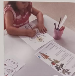
Pretendemos que o projeto fosse transversal às diferentes áreas curriculares.