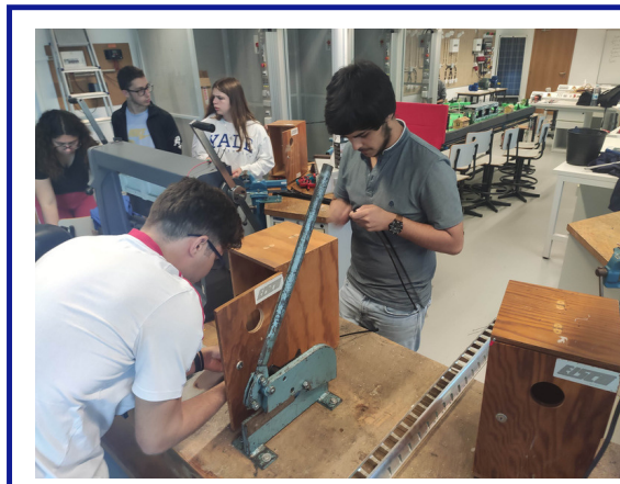
Preparação das caixas a reutilizar

As caixas ninho estão em perfeita harmonia com o contexto em que se inserem.