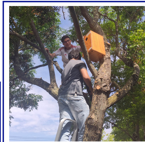
Instalação das caixas-ninho no espaço escolar