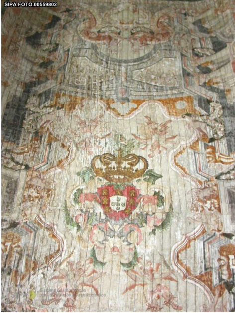
Pintura da madeira do teto da nave