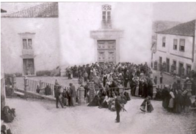
Adro da igreja