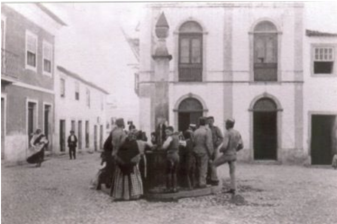
Largo Dr José Rodrigues