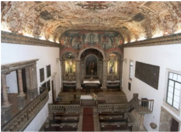
Perspetiva interior da nave única