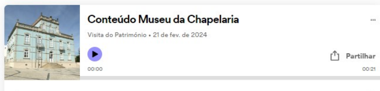
Fig.2 – Acesso aos conteúdos áudio em gravação de Spotify