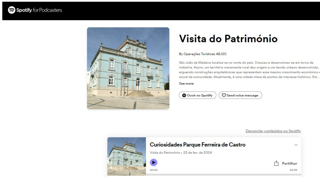
Fig.2 – Acesso aos conteúdos áudio em gravação de Spotify