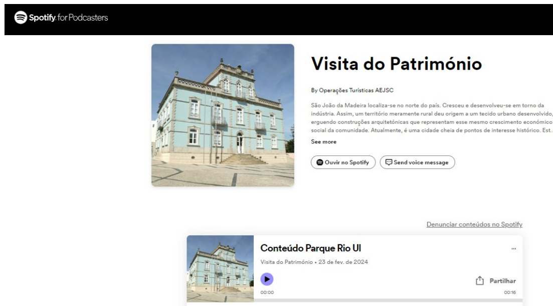
Fig.2 – Acesso aos conteúdos áudio em gravação de Spotify