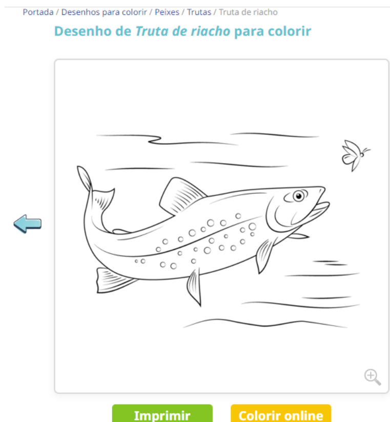
Fig.3 – Acesso a conteúdos infantis – truta para colorir