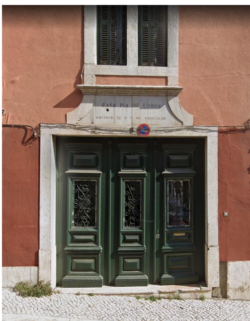
Entrada principal do CED NSC

O edifício da nossa escola data do século XVII e tem uma localização privilegiada, no centro da cidade de Lisboa, mais concretamente no largo do Rato. É um local com História, começou por ser o Convento das Freiras Trinitárias do Rato, em 1721. Pouco sofreu com o grande terremoto, sabendo-se mesmo que deu acolhimento aos salvados de outras igrejas danificadas, incluindo a um famoso crucifixo do senhor Jesus dos Desamparados, que se diz ter pertencido ao convento de São Francisco. Após a extinção das ordens religiosas e a morte da última freira em 1874, foi remodelado e aí instalado o Asilo de Nossa Senhora de Conceição, para as raparigas abandonadas de Lisboa, que ocupou o convento de 1895 em diante. Em 1914, o Asilo passa a designar-se Asilo de José Estêvão de Magalhães, tendo mais tarde passado a funcionar no local uma secção da Casa Pia de Lisboa. Na atualidade, o CED NSC oferece respostas no âmbito da componente de Educação e Ensino na Educação Pré-escolar, nos 1.º, 2.º e 3.º Ciclos do Ensino Básico (CEB) e no Ensino Secundário.