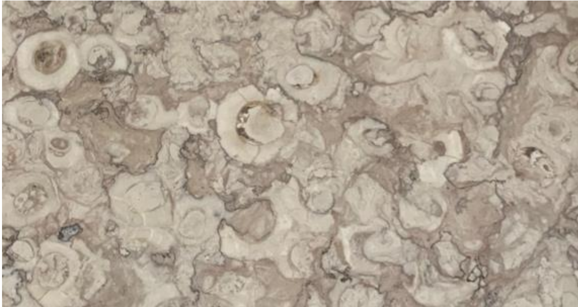
Lioz com fósseis de rudistas

Nas aulas de Ciências Naturais ficámos a saber que há fósseis na nossa escola! Na construção da nossa escola foi utilizada um tipo de rocha especial - o lioz. O lioz é um tipo de calcário (rocha sedimentar) que ocorre na região de Lisboa e que tem uma quantidade enorme de fósseis na sua constituição. Os fósseis presentes no Lioz são maioritariamente Rudistas. Os Rudistas são um grupo extinto de bivalves que vivia em águas quentes e pouco profundas. Os rudistas que podemos ver no lioz da nossa escola são caprinídeos e radiolitídeos.