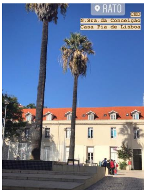
Pátio do CED NSC