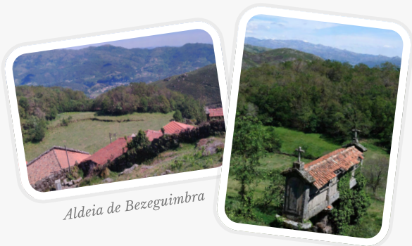
Aldeia de Bezeguimbra

E ste Eco Trilho, denominado de “Trilho Eco-Lobo”, é fruto de uma parceria entre o projeto Eco-Escolas (da Escola Básica de Vila Verde, EBVV), o Município de Vila Verde e o Projeto Internacional LIFE WILD WOLF 1 , surgindo da vontade conjunta em contribuir para a conservação do lobo-ibérico, um predador ameaçado a nível nacional que ainda se encontra presente nas zonas serranas do norte do concelho de Vila Verde.