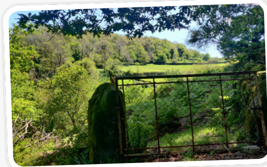
Carvalho com lameiros

E ste “Trilho Eco-Lobo” percorre caminhos transitados por pessoas e lobos, numa área situada entre duas características aldeias de montanha (Gondomar e Bezeguimbra), abrangendo duas das principais bacias hidrográficas do noroeste de Portugal (os rios Lima e Cávado) e em pleno território de uma das alcateias existente no noroeste de Portugal (a alcateia de Vila Verde). Tem como principal objetivo dar a conhecer o património natural (fauna, flora, geologia e hidrografia), o património cultural (edificado, religioso e etnográfico), e o modo de vida do lobo-ibérico, numa paisagem rural moldada pela intervenção humana.