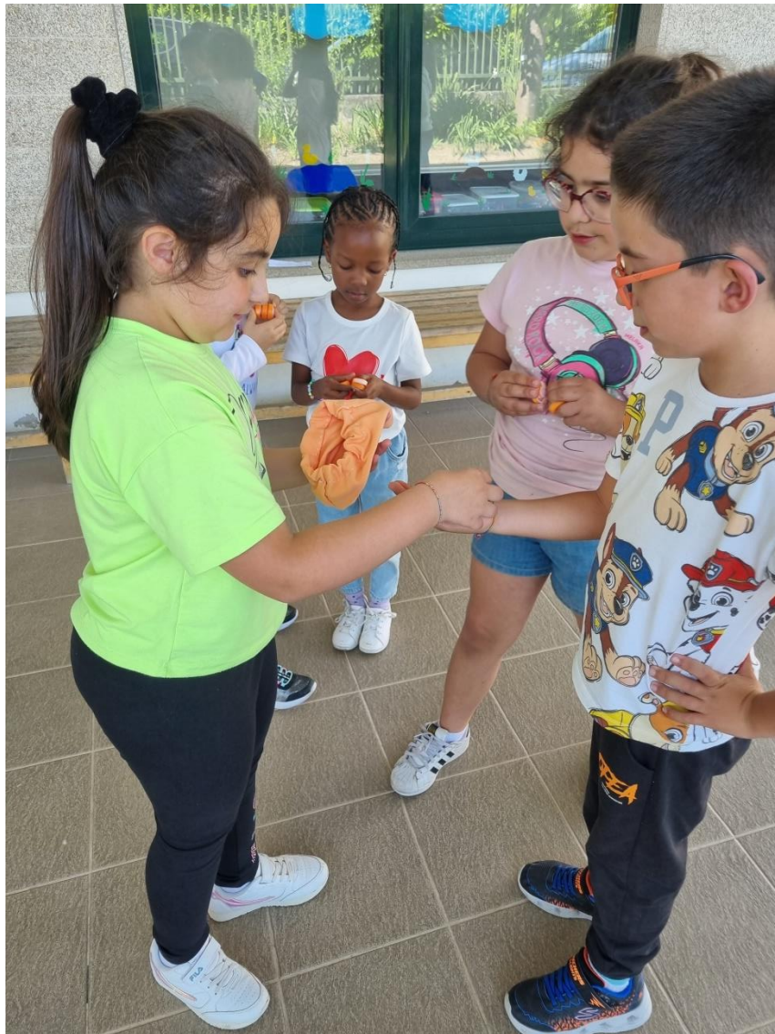
Alunos a distribuir as tampinhas.