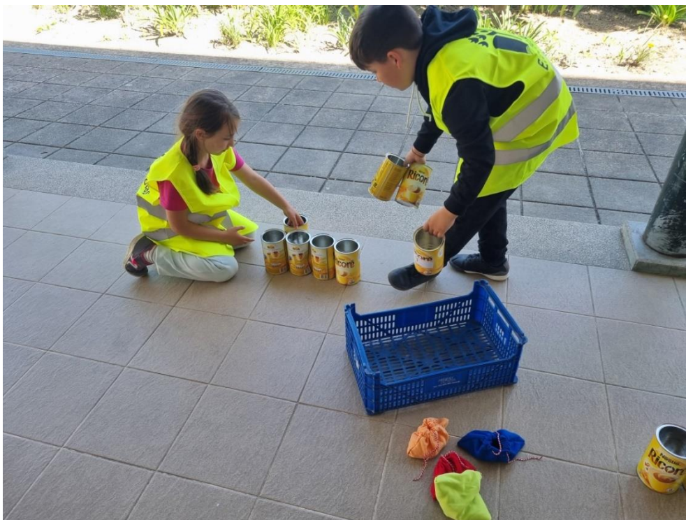
A Brigada a preparar o material do jogo.

Os alunos com a orientação da Brigada dos Recreios com Vida colocam os materiais do jogo em posição. A Brigada é responsável pela aplicação das regras do jogo e da contagem dos pontos.