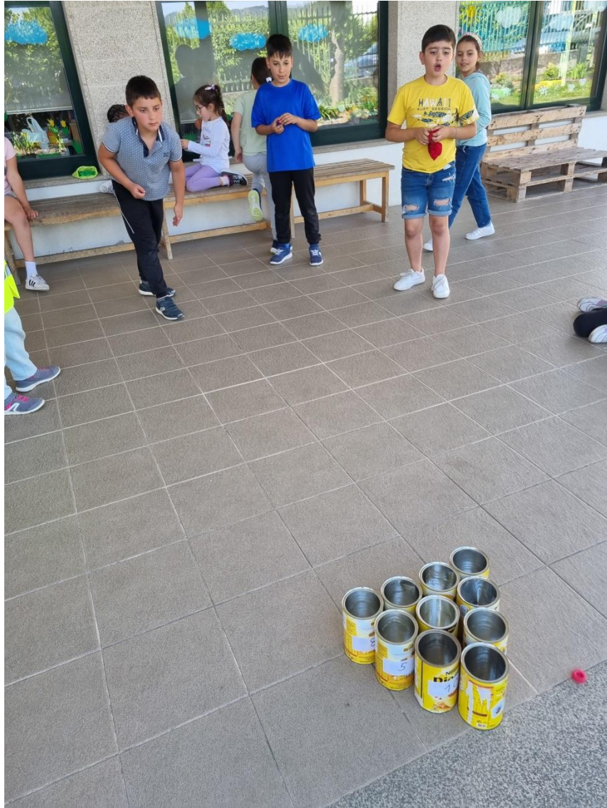
Aluno a jogar.