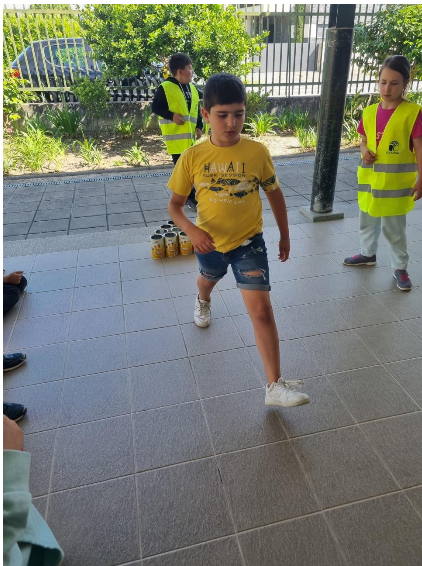
Brigada a verificar se as regras do jogo em relação à disposição das latas e distância dos jogadores estão certas.