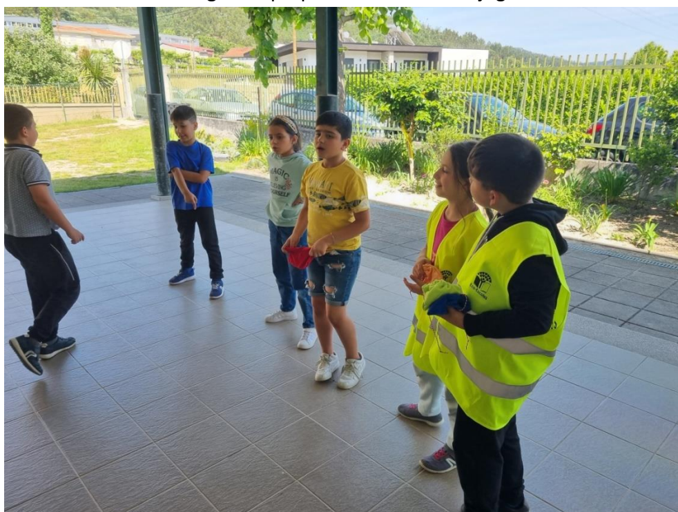
A Brigada a explicar aos alunos o funcionamento e as regras do jogo.