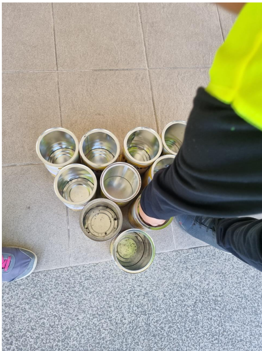
Aluno da Brigada a contar os pontos, para a realização do registo dos pontos.