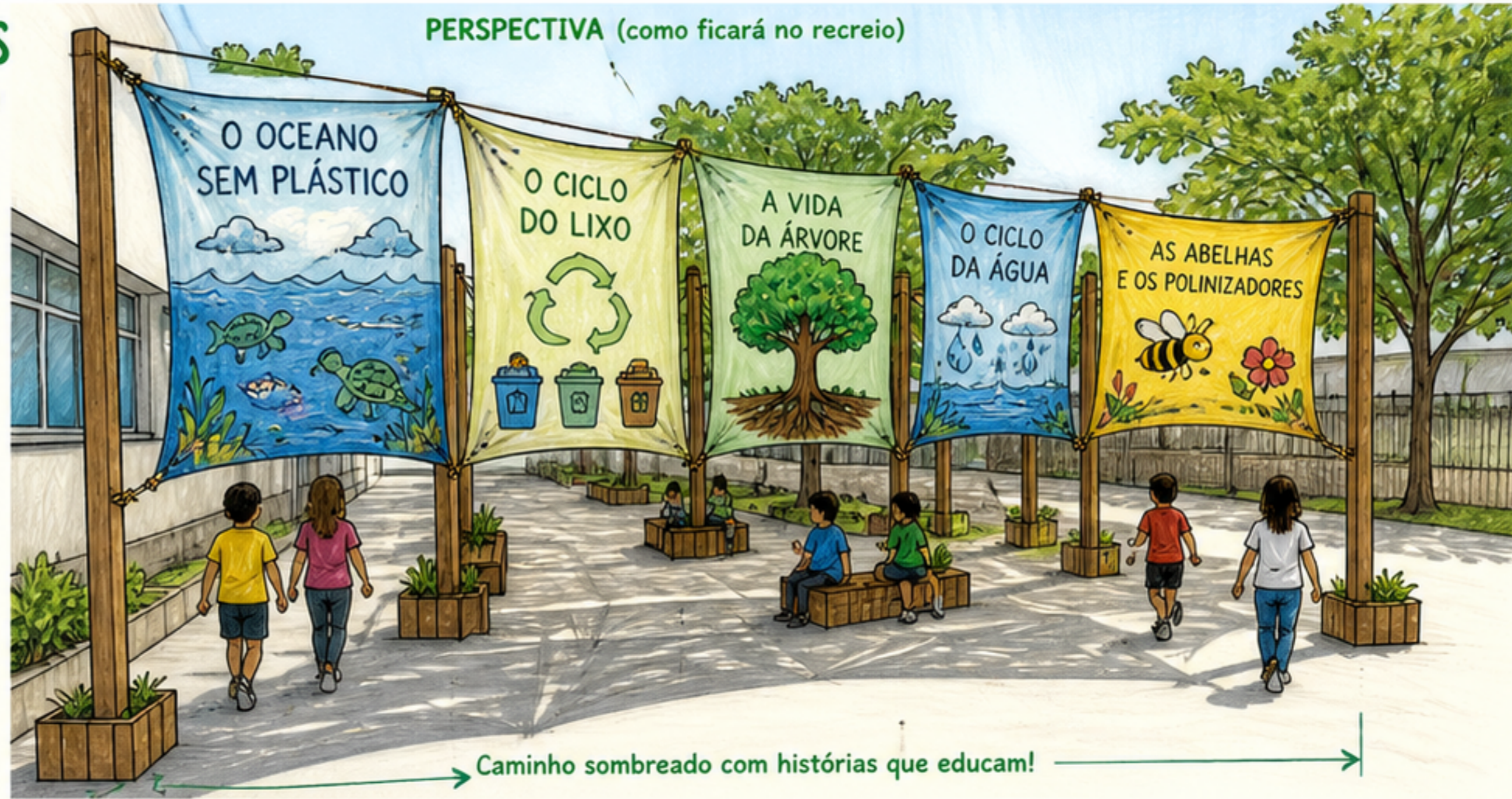
PERSPECTIVA (como ficará no recreio)

Caminho sombreado com histórias que educam!